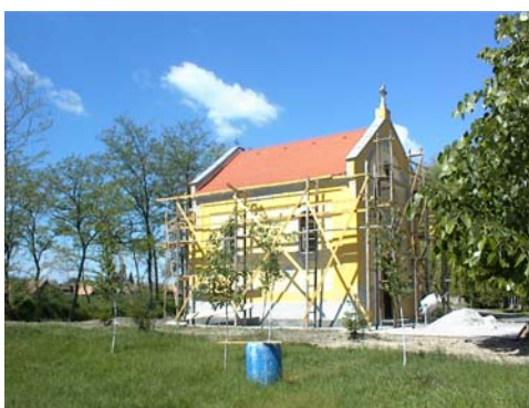
A kápolna felújítása

ták, aki a betegek és szegények védőszentje.