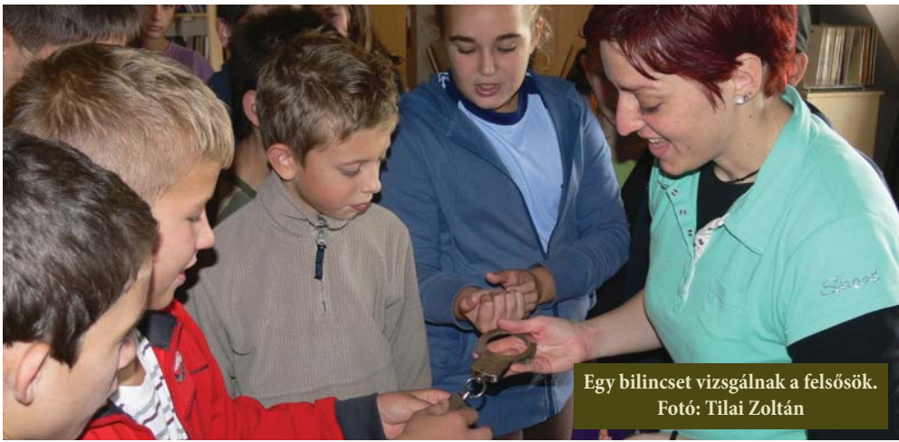
Egy bilincset vizsgálják a felsősök.