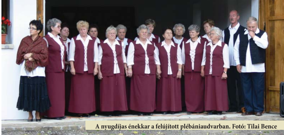
A nyugdíjas énekkar a felújított plébániaudvarban.