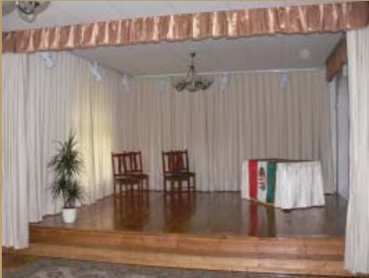
A kultúrház bejárata is megújul. Kis képünkön az új színpad.