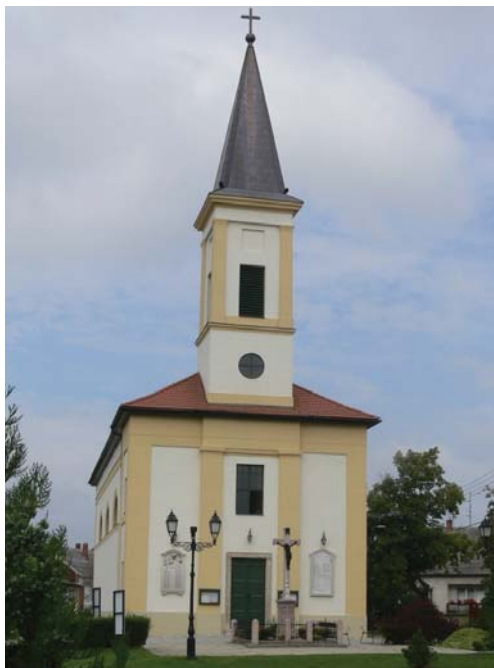
A kunszigeti templom védőszentje Szent Lőrinc, akinek augusztus 10. az ünnepe. A vértanú szenvedését ábrázolja az oltár feletti kép.

A szentmise római kánonjában is helyet kapott, s a régi római naptárban kiemelt ünnep volt vértanúságának napja. Életéről azonban semmi, haláláról is csak néhány megbízható történeti adat maradt ránk