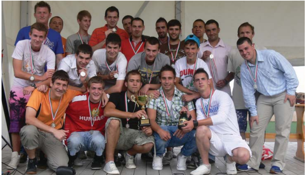
A tartalékcsoport tagjai az ezüstérmekkel.