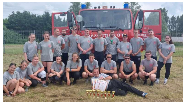
Nyolc kupát nyertek Kunsziget Község Önkéntes Tűzoltó Egyesületének rajai a győrszemerei tűzoltó versenyen május végén.