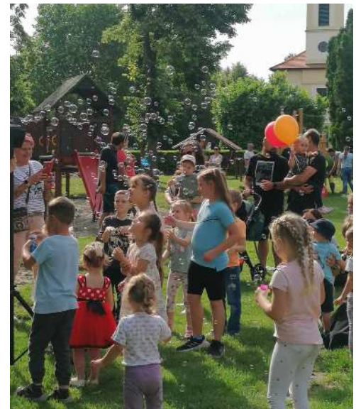
Gyermeknapon adtuk át az új játszóeszközöket Petőfi téri játszótéren.

Az abdai önkormányzat az elmúlt hónapokban - ugyancsak az önkormányzati külterületi utak felújítását célzó pályázat keretében - aszfaltozott úttal összekötötte a két korábban elkészült utat. Ennek eredményeként szilárd burkolatú úton lehet már közlekedni Abda és Kunsziget között.