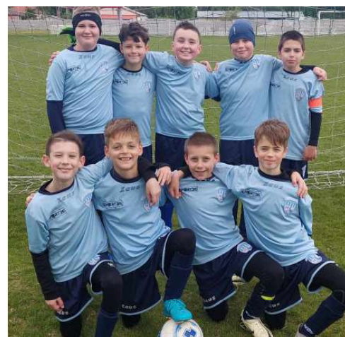
Az U11-es együttes.