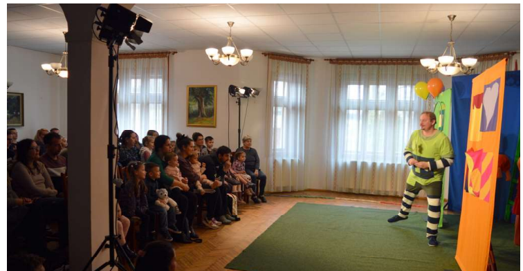
Az Aprók Színháza a Nem, nem hanem című előadást hozta márciusban Kunszigetre.