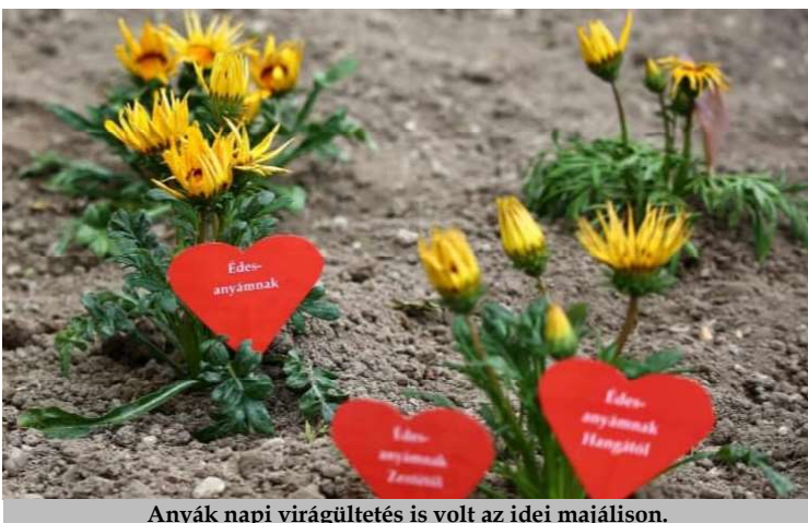
Anyák napi virágültetés is volt az idei majálison.