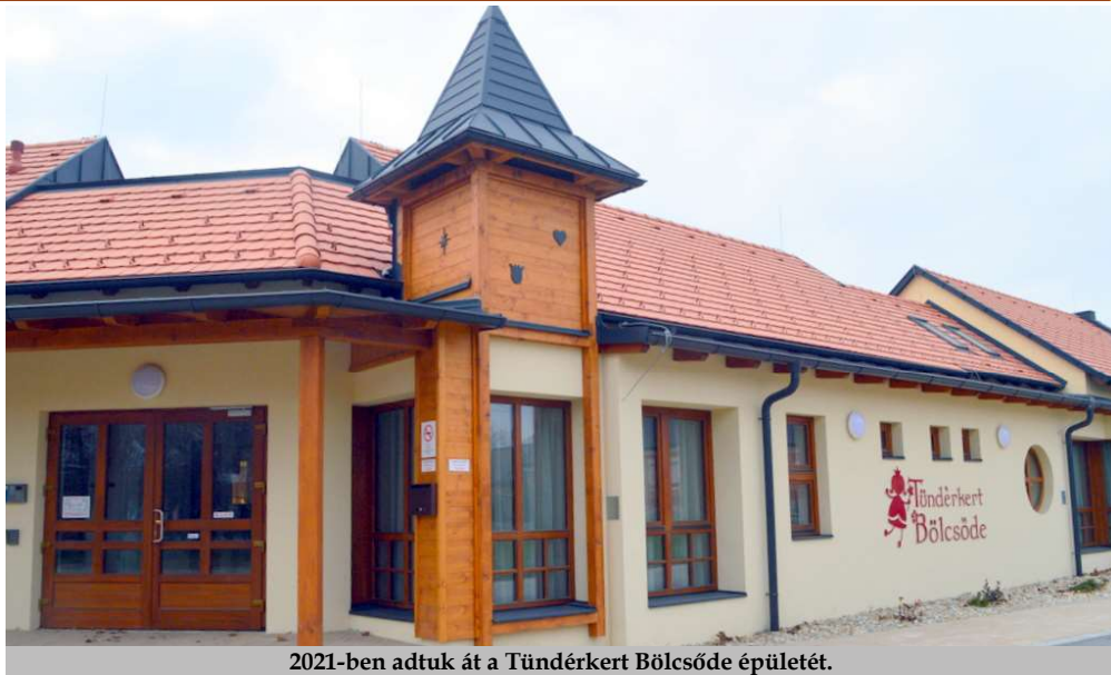
2021-ben adtuk át a Tündérkert Bölcsőde épületét.

Magyarország 21 képviselőt küldhet majd az Európai Parlamentbe.