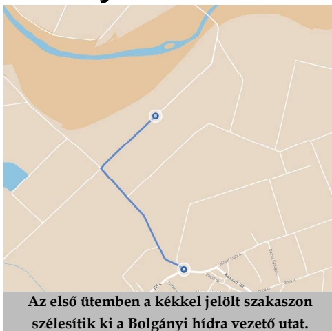
Az első ütemben a késsel jelölt szakaszon szélesítik ki a Bolgányi hídra vezető utat.

Az önkormányzati épületek energetikai korszerűsítését célzó projekt keretében az év elején elkezdődött az egészségház felújítása. A munkálatok idejére a kultúrházba „költözött” az orvosi rendelés, a védőnői szolgálat és a gyógyszerelátás is.