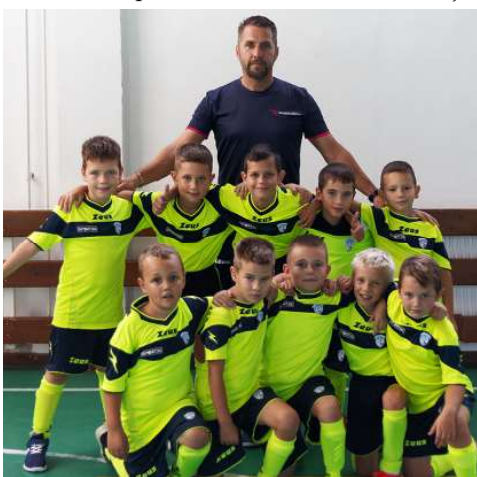
Az U9-es korosztály játékosai és edzője.