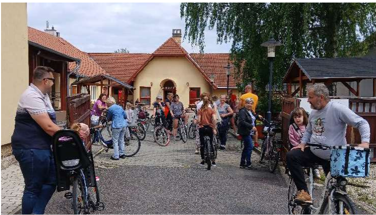
Két keréken Kunszigeten - sokan vettek részt a kerékpáros túrán május 1-jén.