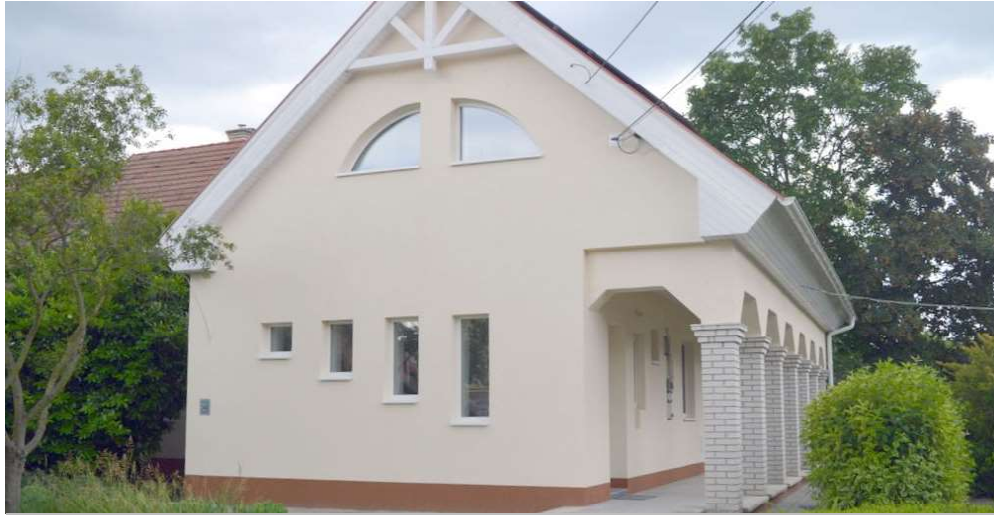
Az egészségház felújítása a befejezéshez közeledik.