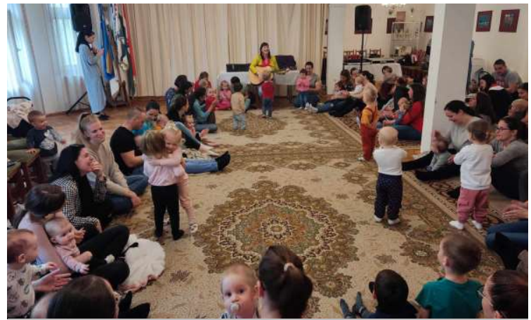
Kerekítő foglalkozáson vettek részt a legkisebbek április elején.