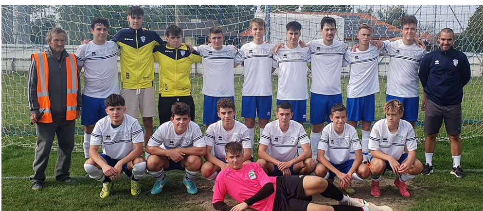
Az U19-es együttes a vármegyei I. osztályban is helyt állt.