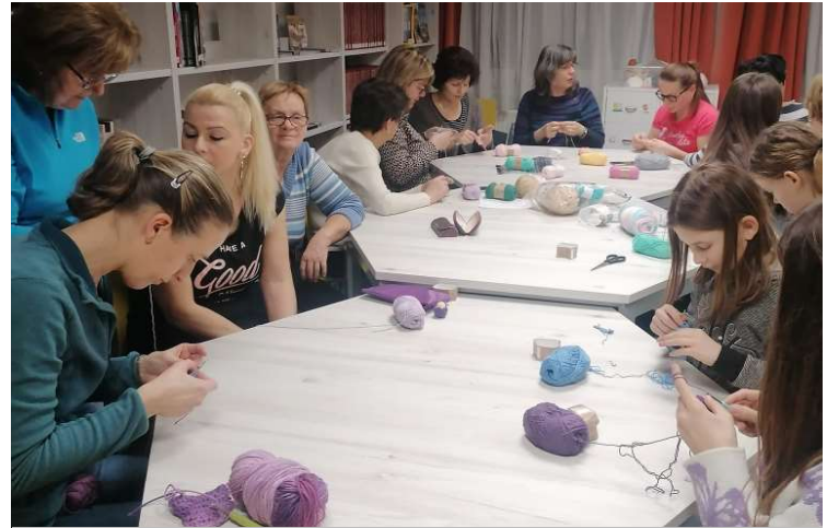
Februárban horgoló klub indult a kultúrházban és a könyvtárban, amelyhez folyamatosan csatlakozhattak az érdeklődők. A klub őszi szünetet tart, akkor újra várják a régi és az új tagokat.