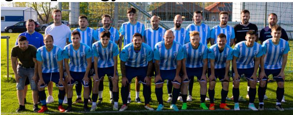
A vármegyei II. osztályban szereplő felnőtt csapatunk.

Az igazi bajnoki forduló a serdülő csapatoktól indulnak (U16-os korosztály). U16-os csapatunk a Vármegyei U16 Mosonmagyaróvári csoportban az 5. helyen végzett. A szezon elején egy teljesen újjászervezett csapattal indultunk, mivel a korábbi játékosaink nagy ré-