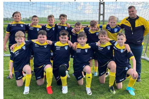
Az U13-as korosztály csapata.

Az egyes fordulóik eredményei és a bajnokságok végeredménye az MLSZ adatbanki oldalán ( adatbank.mlsz.hu ) megtekinthetők. További információk a Kunsziget SE facebook oldalán ( facebook.com/kunszigetse ).