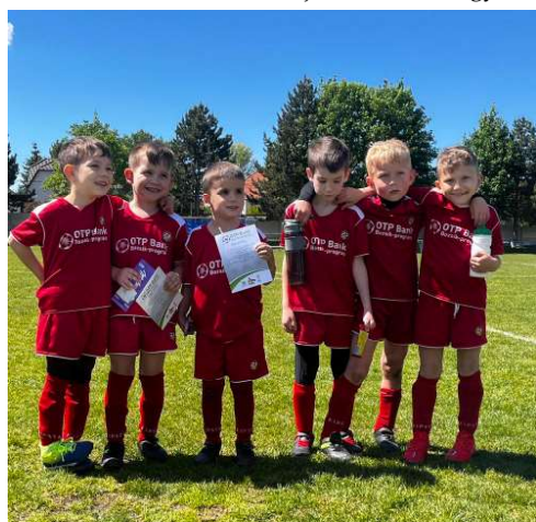
A legfiatalabbak, az U7-es csapat.